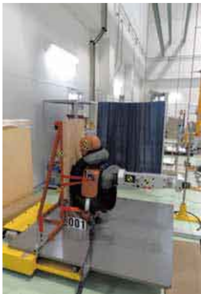
インパクタ打撃位置

インパクタ衝突面・丸型使用 衝突速度 : 4.2m/s (15 km/h) エアプロテクターベストのエアバッグ部分が完全に展開した状態で試験を実施 エアバッグの圧力 : 20 kpa