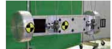
インパクタ衝突面・丸型 インパクタ質量 23.3 kg